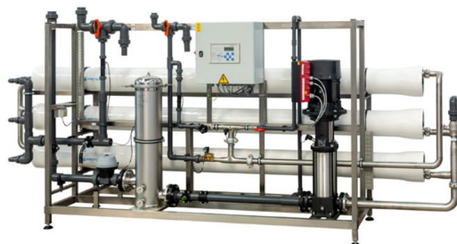
UO-D 10000 AS/FU

Sie haben ein spezifisches Projekt und wollen mehr wissen oder möchten anhand einer Betriebskostenrechnung Ihre Vorteile kennenlernen?